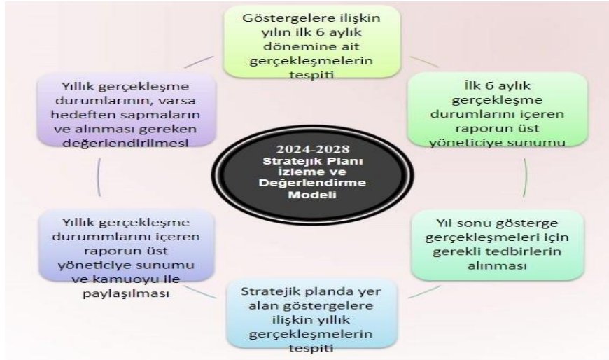
Tablo 34. İzleme ve Değerlendirme Şablonu

düzenli olarak kamuoyu ile paylaşılacaktır.